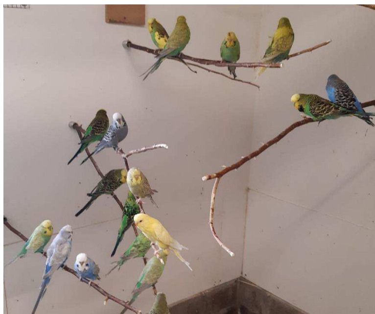
Une volée de perruches ondulées dans la volière