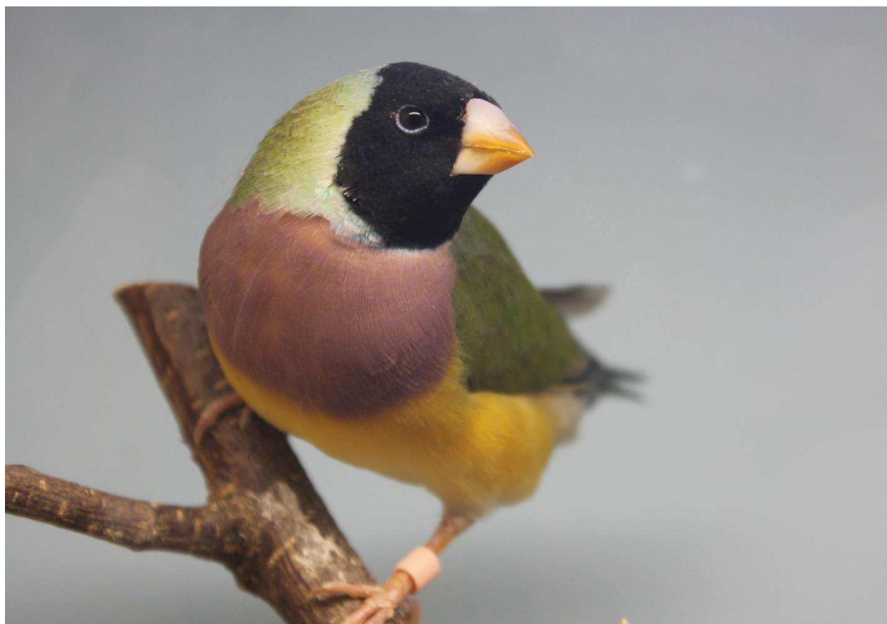
0.1 Amadine de Gould à tête noire